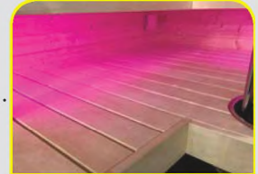
XL FLÄCHEN LIEGE