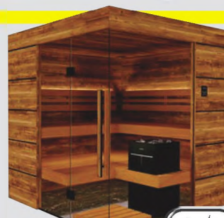
Tyrol Holz & Thermo Espe