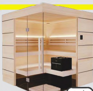
Nord. Fichte & Espe hell