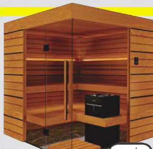
Thermo Espe komplett